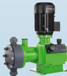
DMH Robusni raspon DMH membranskih klipnih pumpi osiguravaju visoki tlak i širok raspon doziranja do 2 x 1500 l/h.