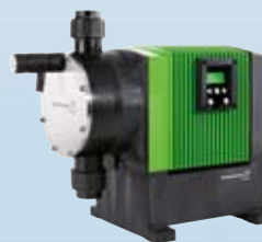
DME DME serija visoko preciznih digitalnih pumpi za doziranje precizno dozira od 2.5 ml/h do 940l/h.