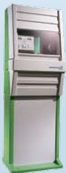
Vaccuperm Vaccuperm sistem za dezinfekciju mjeri koncentraciju plinskog klora i kontrolira dozirni protok.

Grundfos Alldos ima iskustvo, stručnost, resurse i program za rješavanje apsolutno svih Vaših zahtjeva.