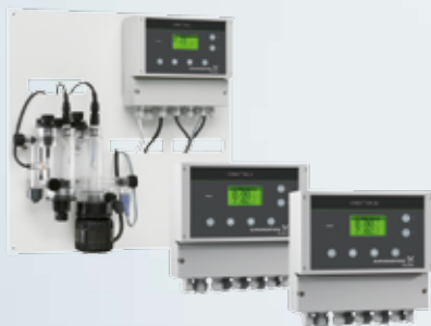
Conex asortiman visokopreciznih upravljačkih uređaja uključuje kompletan, prethodno sastavljen sistem za jednostavnu instalaciju.

Naš asortiman mjernih elektroda osigurava precizne informacije o velikom broju parametara. Dizajnirani specijalno za obradu vode, u mogućnosti smo opskrbiti Vas sa elektrodama otpornim na tlak, jednokrakim sondama koje ne zahtijevaju održavanje i mjernim elektrodama sa membranom.