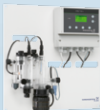
Conex Ove univerzalne mjerne i upravljačke jedinice sa jednostavnim korisničkim interface-om rade sa širokim spektrom parametara.